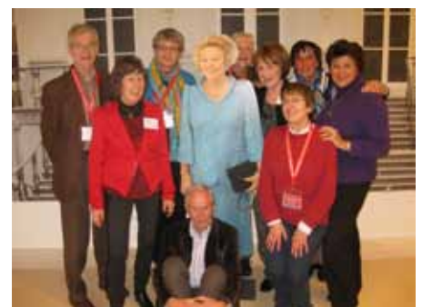
Het vrijwel voltallige coördinatieteam van Gilde SamenSprak poseert rond de afbeelding van koningin Beatrix in het Huis voor democratie en rechtsstaat.