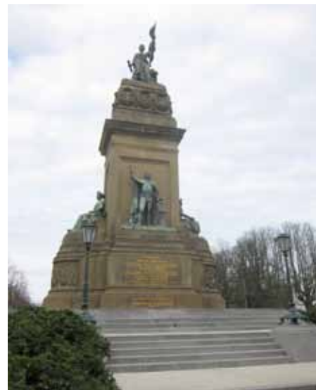
Plein 1813.

Een wandeling van ongeveer 1½ uur door de binnenstad van Plein naar Plein 1813. Aandacht zal vooral worden besteed aan onderwerpen, die betrekking hebben op het koningshuis en de staatsinrichting sinds 1813. De wandeling voert langs diverse huizen van Oranje en andere locaties, die een rol hebben gespeeld bij of herinneren aan de totstandkoming van ons koninkrijk. Verwacht wordt dat deze wandeling rond 30 april gereed is. Tegen die tijd staat er meer informatie hierover op onze website www.gildedenhaag.nl