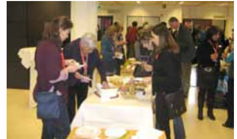
De deelnemers aan de feestelijke bijeenkomst konden zich te goed doen aan bijzondere hapjes, zoals die gegeten worden in het land van herkomst van de anderstaligen.

Het officiële gedeelte werd gevolgd door een programma onder leiding van enkele medewerkers van ProDemos. Na een inleidende film over het werk van de Tweede Kamer werden de aanwezigen verdeeld over een tweetal groepen voor een bezoek