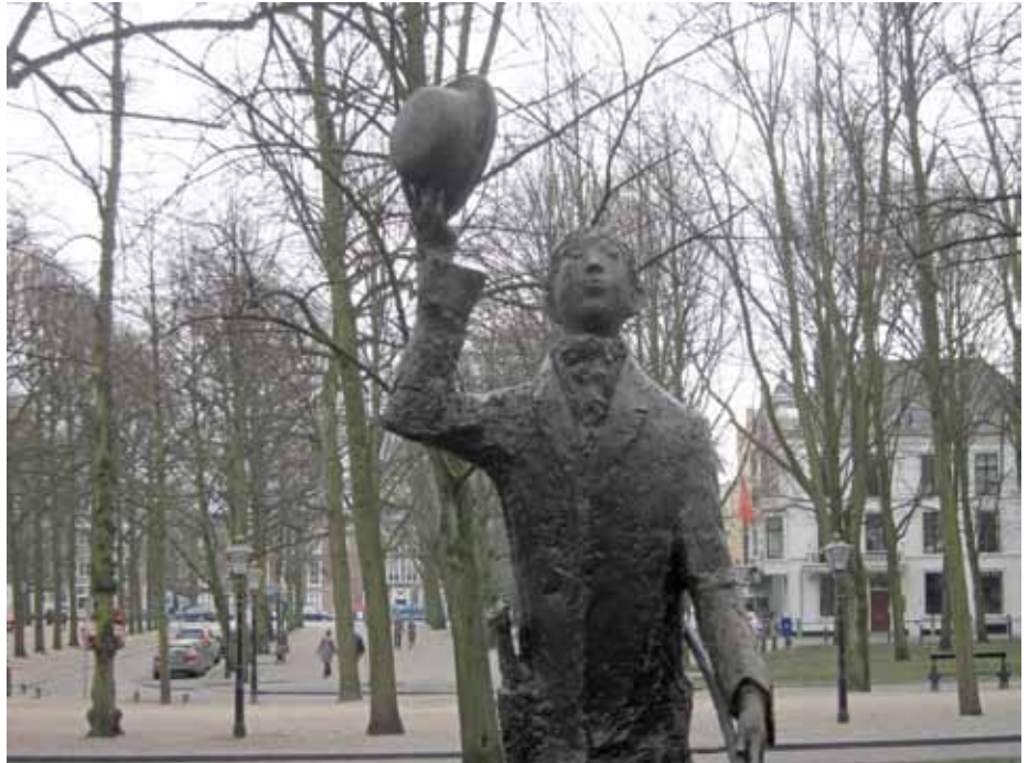
De Flaneur op het Voorhout.

Het Plein is dit jaar het middelpunt van alle activiteiten. Hier is een informatiemarkt. Bezoekers van de Dag van de Haagse Geschiedenis kunnen hier hun toegangskaartjes voor de verschillende activiteiten halen. Bijna alle deelnemers bieden hun activiteit meerdere keren aan. De meeste activiteiten, lezingen en rondleidingen