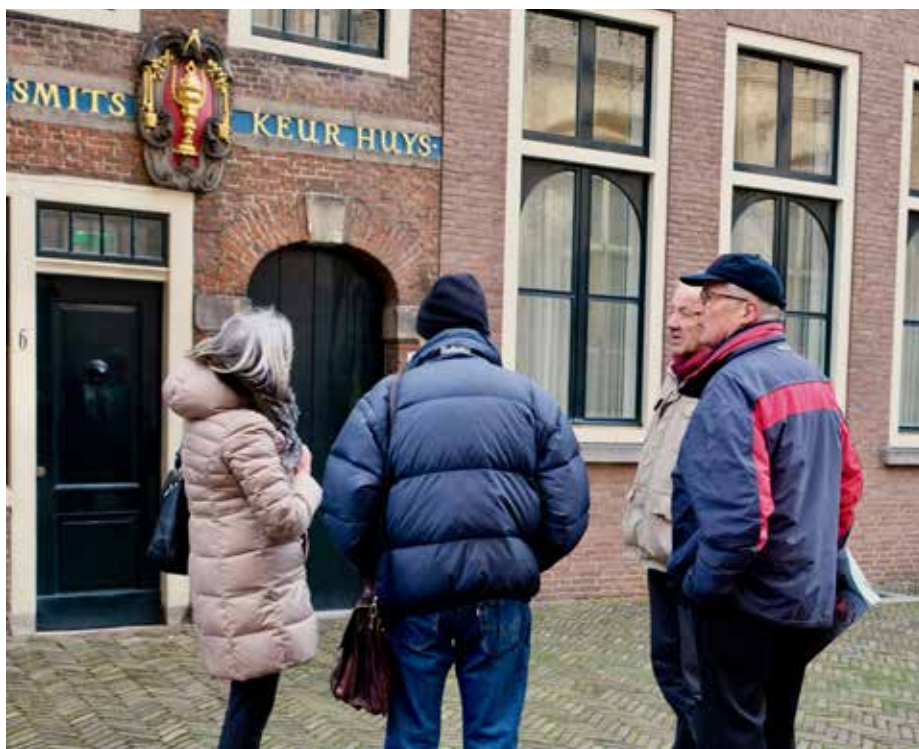
Gidsen voor het pand van het Haagse goud- en zilversmidsgilde St. Andries.