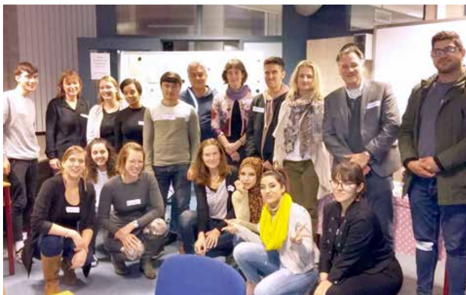
Kick-off project Taal & Toekomst, 27 november 2018.

Inmiddels zijn projecten opgezet in Breda, Den Haag, Groningen, Rotterdam, Veldhoven en Zoetermeer. In Den Haag zijn Stichting Taal aan Zee en Gilde SamenSprak in september vorig jaar gestart met de werving van jongeren en vrijwilligers. Eind november 2018 vond de kick-